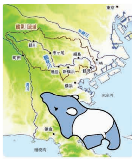
鶴見川の流域はバクの形