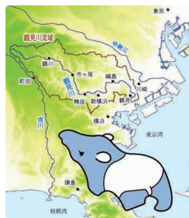
鶴見川の流域はバクの形