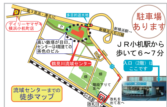
JR横浜線小机駅より歩いて6~7分