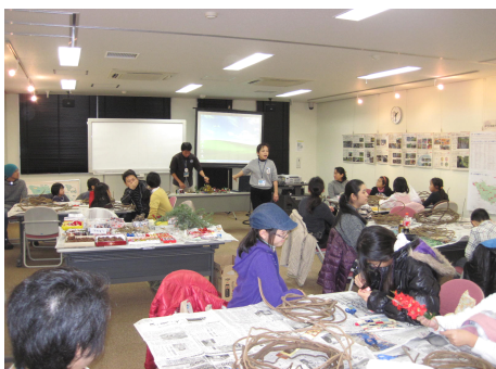
みんなでわいわいリースづくり♪

日時 12月2日(日) 13:30~15:30 場所 1Fコミュニティルーム 講師 亀田佳子(フラワーデザイナー) 定員 20名(事前申し込み 定員になり次第締め切り) 参加費 300円+200円(材料代) 対象 小学生~(小学3年生以下は必ず保護者同伴) 持ち物 リボンなどお好みのオーナメント 友の会ポイント 3P(来館1P+イベント2P=3P)