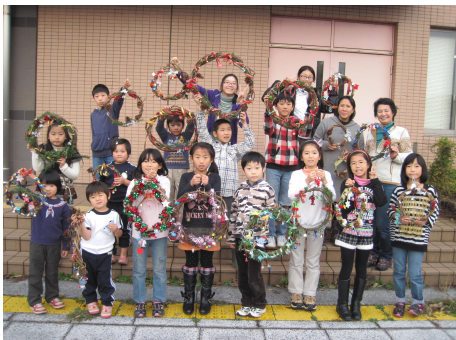
みんなで記念撮影!!