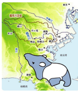
鶴見川の流域はバクの形