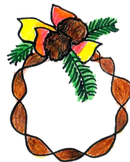
お正月の飾りにもなります。 そのご紹介もします。

主催:地域防災施設 鶴見川流域センター 共催:連携鶴見川流域ネットワーク 協力:デイリーヤマザキ横浜小机町店