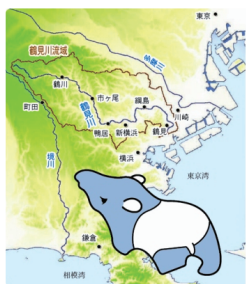
鶴見川の流域はバクの形