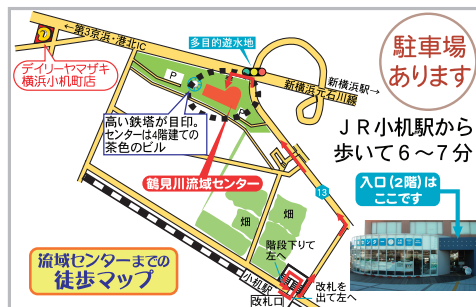
JR横浜線小机駅より歩いて6~7分