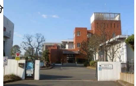
港北水再生センターのHPより

集合：地域防災施設鶴見川流域センター 9時30分 解散：鳥山大橋 12時30分頃 参加費：300円 友の会ポイント：3P 定員：20名（事前申込制・先着順） 持ち物：飲み物 帽子歩きやすい服装と靴 雨具 申し込み：裏面の申し込み用紙にご記入の上、 FAXでお申し込みください。