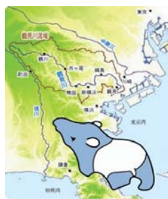
鶴見川の流域はバクの形