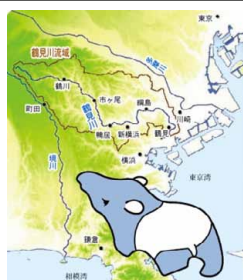
鶴見川の流域はハクの形