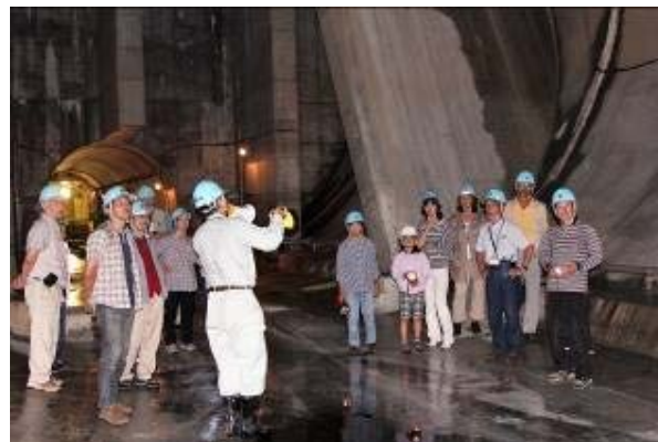
地下25m・直径16m 長さ600mの貯水トンネル