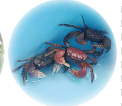
数は少ないですがベンケイガニ(赤)もいます。