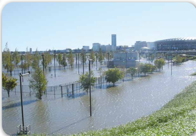
河川水が越流した鶴見川多目的遊水地

台風19号は、鶴見川多目的遊水地が有効に機能し、水害は起こりませんでした。流域にどう雨がふるか?ビー玉ころころで流域のこと、遊水地のことを学びましょう。