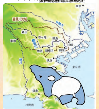
鶴見川の流域はバクの形