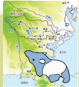
鶴見川の流域はバクの形