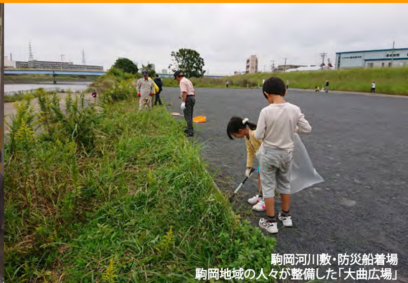
駒岡河川敷・防災船着場 駒岡地域の人々が整備した「大曲広場」