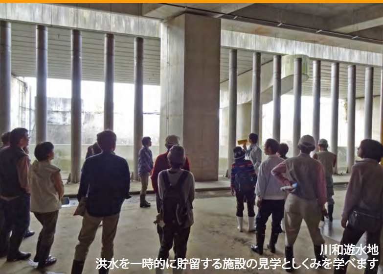
川和遊水地 洪水を一時的に貯留する施設の見学としくみを学べます