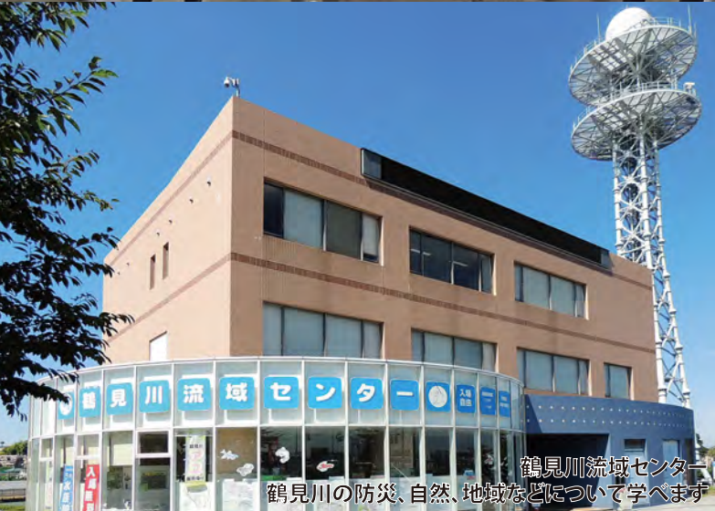
鶴見川流域センター 鶴見川の防災、自然、地域などについて学べます