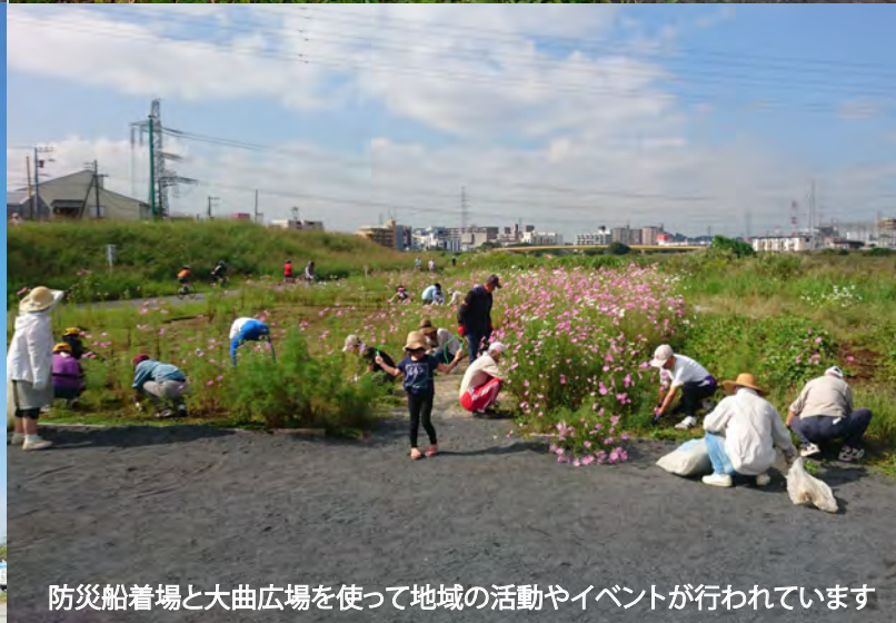
防災船着場と大曲広場を使って地域の活動やイベントが行われています